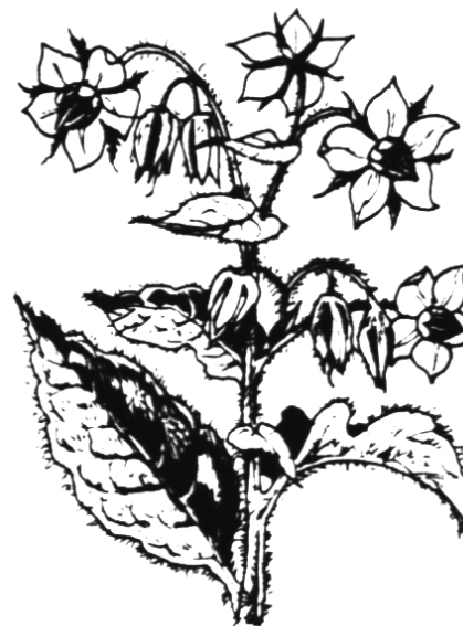
Borago officinalis BOURRACHE

Multiplication : semer en pépinière en automne. Repiquer au printemps. Il est possible de semer en place au printemps (mars) sur terrain bien préparé, recouvrir très peu la graine.